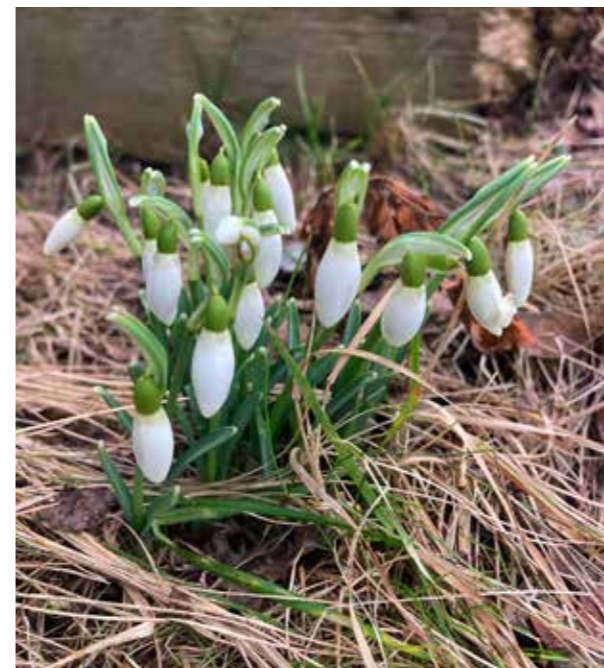
Strävsamma snödroppar på Husby gård.

Året har startat för ett bra tag sen och nu är det hög tid att skriva något om vad som händer och har hänt i vår på Husby gård. Vi har kört hantverkscafé i Storstugan vilket visade sig vara väldigt populärt. Deltagarna tar med sig sina projekt och skapar sedan tillsammans med andra deltagare och får råd och tips av hemslojds konsulenter.